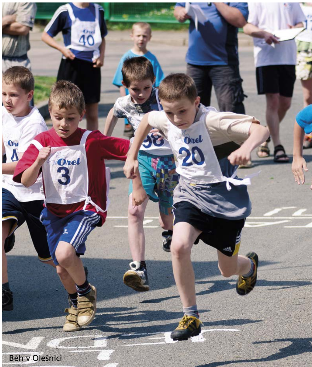
Běh v Olešnici