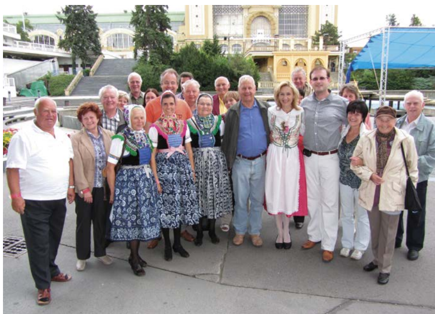
Ze spolupráce katolického Orla s lužickosrbským sdružením Njepilic Dór

Naši přátelé z lužickosrbského národopisného selského spolku Njepilic dwór (Nepila-Hof) pobývali ve dnech 25.–26. června 2011 v České republice. Jejich