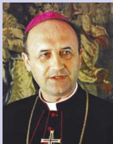
+ JAN GRAUBNER, arcibiskup duchovní rádce Orla

pro mladé lidi utopené v kultuře, která je neúnavně poučuje, že mají jít za bezprostředním uspokojením. Ukazuje na velké křesťany jako modely pravého života. Její poselství? Bud' můžete usilovat stát se jedním z nich – budovatelem civilizace, velkým geniem, služebníkem Boha i lidí, odhodlaným misionářem, nebo můžete být sebestřednými nulami, lpicími na uspokojení své chuti. Naše společnost dělá vše pro to, abyste se vydali tou druhou cestou. Osvoďte člověka v sobě. Pozvedněte se nad stádo, vyhlaste svou nezávislost na kultuře, která si o vás myslí tak málo, a prohlaste, že miníte žít nikoli jako zvěř.