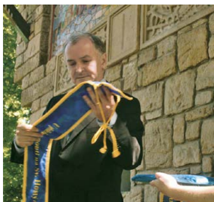
Předávání pamětní stuhy