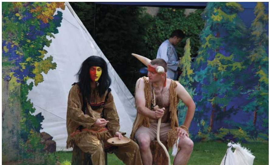
Divadelní spolek Slovan hra Sucho