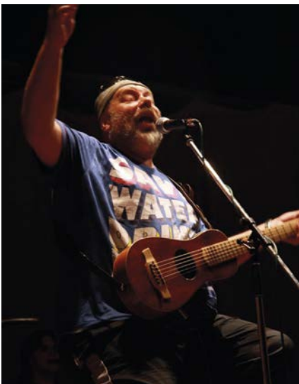
K oslavě přispěla i kapela Fleret