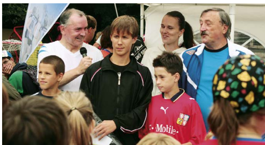
Dovednostem dětí přihlížel mimo jiné i starosta Orla