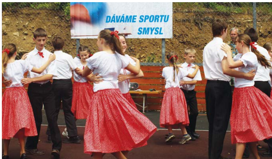
Taneční soubor ze Žatčan

V neděli 5. 6. 2011 proběhla prezentace spolků a organizací zabývajících se volnočasovými aktivitami dětí, mládeže i dospělých. Po 3 letech konečně přálo počasí a celá akce proběhla pod širým nebem v areálu Rybníčky ve Starém Městě. Přítomní mohli shlédnout vystoupení Orla, Sokola, Dolinečky, SVČ Klubko, Sboru dobrovolných hasičů a šermířů, zastavit se u stánků jednotlivých organizací, zasoutě-