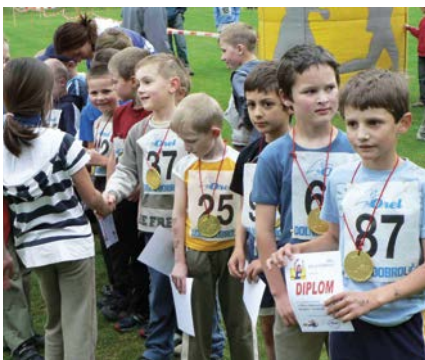
... a ze současnosti

Výstavou dostupných dokumentů a výtiskem brožury, od začátku až po současnost, si v září připomeneme 100leté výročí založení Jednoty Československého Orla v Dolní Dobrouči.