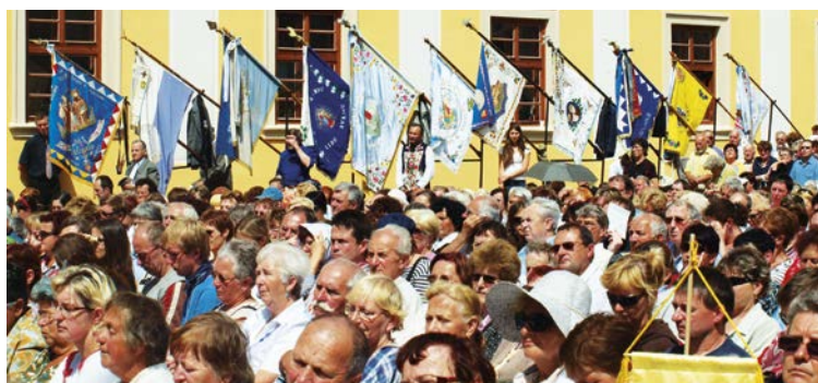
Nechyběly ani orelské prapory

Všichni lidé dobré vůle se sešli 4. a 5. července na Velehradě. Ať už měli k cestě sem jakýkoliv důvod, sešlo se nás zde letos na 40.000. Národní pouť se zde koná již od roku 2000 a dá se říci, že je to jedna z nejvýznamnějších církevních událostí. Pro Orly mají tyto dny ještě hlubší význam. Pravidelně se schází u hrobu svého zakladatele Mons. Jana Šrámka.