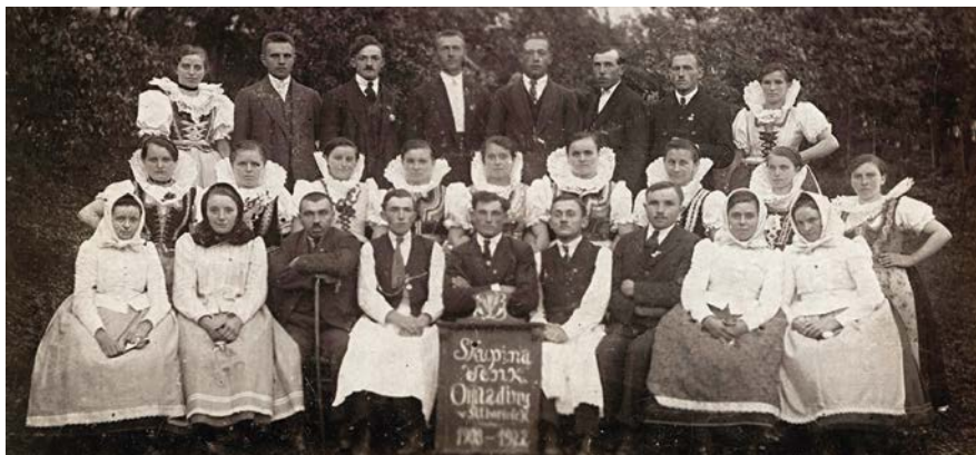
1922 – Skupina Omladiny

V letošním roce slaví jednota Orla Šitbořice 100leté výročí od svého založení. Zakládací listiny se sice nenašly, ale z knihy zápisů ze schůzí z období mezi únorem 1931 a 27. říjnem 1951, se dají vyčíst a odvodit fakta o založení.