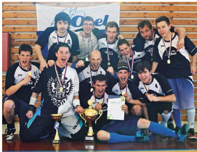
1. místo Zlín.

Nedělní čtvrtfinále žádná překvapení na úkor vítězů skupin nepřinesla. Uherské Hradiště si snadno poradilo 12:3 s Haviřovem , Zlín měl s Velkými Němčicemi problémy jen ze začátku utkání, nakonec si připsal výhru 9:3. Jasný průběh měly i zbylé dva čtvrtfinálové duely. Prvně si Blansko B poradilo s Kuřimí 6:2, záhy na to Boskovice porazily 6:3 Šlapanice . Semifinále už nabídla mnohem dramatictější chvíle. Zlín přetlačil bojovné Blansko B až v samém závěru, když vítěznou branku vstřelil necelých 15 sekund před koncem a zvítězil těsně 4:3. Druhé semifinále vypadalo na