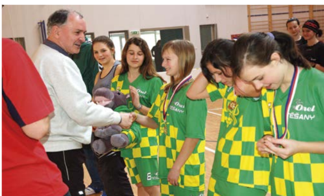
Vítězné družstvo z Těšan.

Díky lepšímu skóre ze vzájemných zápasů se staly mistryněmi právě skončeného ročníku. Druhé místo obsadily žákyně Brna-Bohunic a bronzovou medaili získaly Šitbořice .