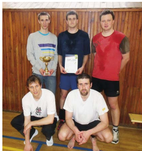
2. místo Letohrad muži.