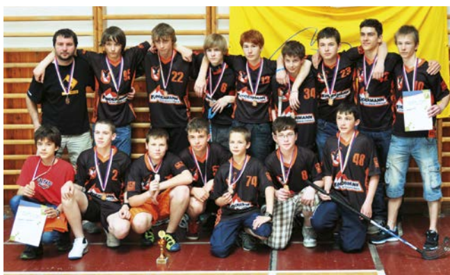
3. místo Boskovice.

ce v prodloužení získaly alespoň bronzové medaile. Finále ovládlo Nové Město na Moravě, které mělo většinu zápasu pod kontrolou a zcela zaslouženě se stalo mistrem OFL pro rok 2011/2012.