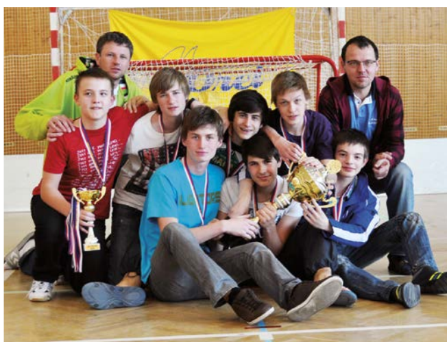
1. místo Šlapanice.

Po odehrání zápasů 2 x 10 minut každý s každým se vítězným týmem a mistrem OFL v kategorii dorostenců pro rok 2011/2012 stal Orel Šlapanice . Šlapanice prošly celým turnajem s jediným zaváháním, když ztratily body s Uherským Brodem po remíze 3:3, v celkové tabulce si připsaly 13 bodů. Druhé skončily s 12 body Boskovice, které první místo prohrály ve vzájemném souboji se Šlapanicemi, když jim podlehly 2:6. Třetí místo obsadila Olešnice, zaznamenala 3 výhry, prohrála pouze s vítězem a druhým týmem turnaje. Čtvrté místo obsadila Ostrožská Nová Ves se 6 body, pátý byl Uherský Brod s 2 body a poslední, šesté místo, obsadil Kelč s jedním bodem.