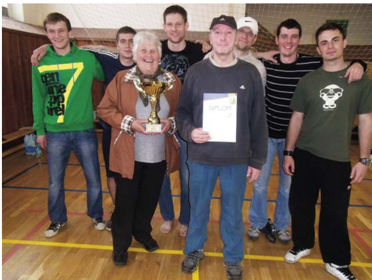
1. místo Mramotice muži.