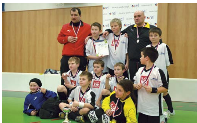
2. místo Uherský Brod.