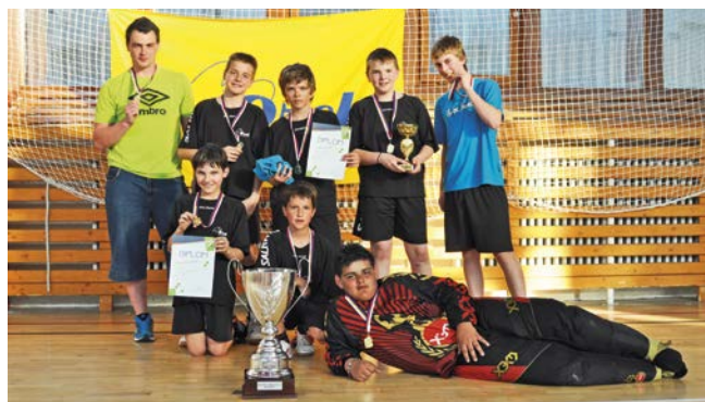
1. místo Dolní Bojanovice.

V prvním čtvrtfinálovém zápase překvapivě vypadl po velkém boji Kunštát, který nestačil na Nové Město na Moravě. V řádné hrací době skončilo utkání 0:0, na nájezdy se už ale radoval čtvrtý celek skupiny B. Že semifinále zaberou pouze celky z této skupiny, se ukazovalo i nadále. Nivnice s přehledem porazila