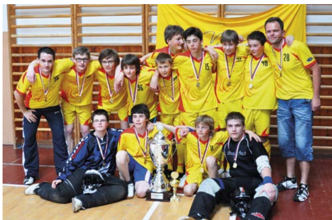
1. místo Nové Město na Moravě.

První nedělní zápasy nepřinesly žádné drama, týmy Brodu a Boskovic nezaváhaly a postoupily do semifinálových bojů. Uherský Brod si poradil s Bojanovicemi, Boskovice s Hranicemi. Zbývající čtvrtfinálové duely znamenaly o poznání zajímavější podívanou. Nové Město na Moravě kvalitním výkonem přešlo přes silnou Nivnici a v posledním zápase si Kunštát i přes nezvládnutý závěr základní hráčské doby zajistil postup přes Kelč v samostatných nájezdech. Semifinále už znamenala konec pro dvojici favoritů, Nové Město zdolalo Boskovice a domácí Uherský Brod překvapivě nestačil na Kunštát, který ve skupině porazil. V bitvě smutných semifinalistů Boskovi-