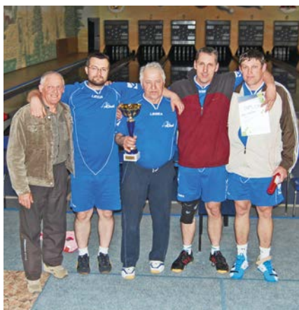
Vítězné družstvo Ivančice.