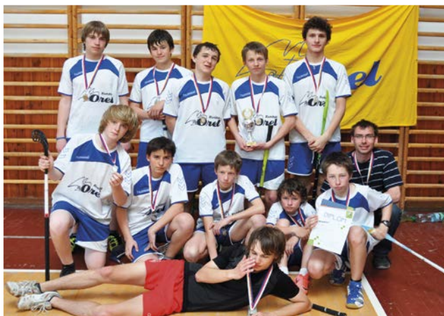
2. místo Kunštát.