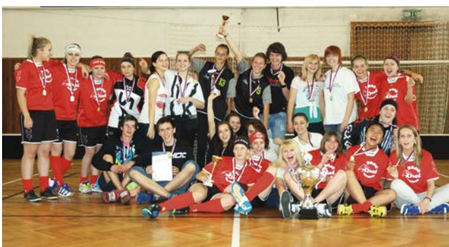
1.–3. místo juniorky.

Poslední kolo konané 12. 5. 2012 v Letovicích už nemohlo nic změnit na faktu, že mistryněmi se staly hráčky Brna-Bohunic . Za celý ročník nepoznaly hořkost porážky, připsaly si 12 výher, plný počet bodů a fantastické skóre