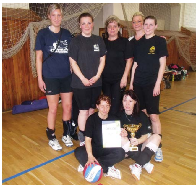
2. místo Zlín ženy.