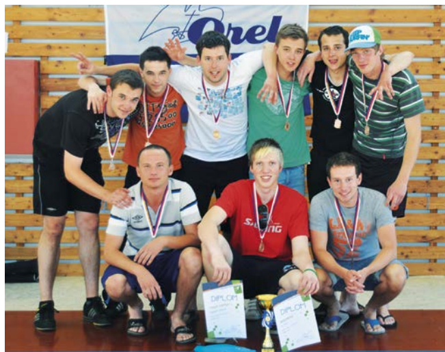
3. místo Boskovice.

jasnou záležitostí, Uherské Hradiště vedlo 6:0 a pohodlně kráčelo do finále. Boskovice se ovšem nevzdaly a i díky laxnosti hráčů Hradiště těsně před koncem snížily na 7:6, více už však nestihly, a tak do finále postoupil i druhý celkem z východu, Uherské Hradiště. Zápas o bronz byl jasnou záležitostí Boskovic , které porazily odevzdané Blansko B 11:3. Zato o vítězství se strhla bitva mezi loňskými mistry z Uherského Hradiště a Zlínem. Celý zápas se skóre přelávalo z jedné strany na druhou, šťastnějším se nakonec díky brance ke konci zápasu stal Zlín , který se stal mistrem OFL 2011/2012 .