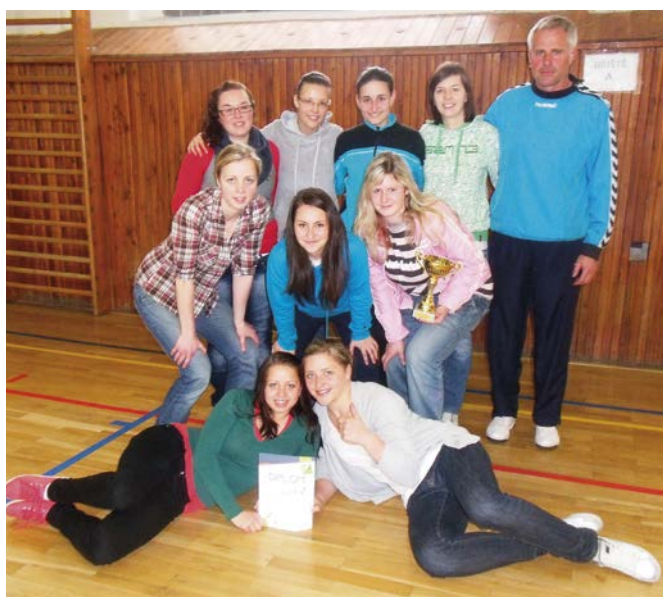
3. místo Stěbořice ženy.