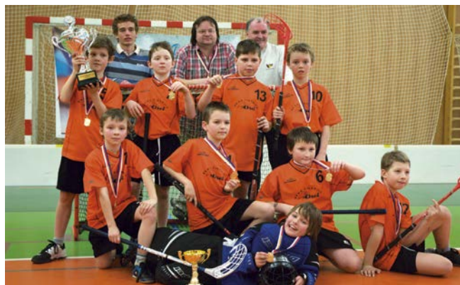
1. místo Brno-Židenice.