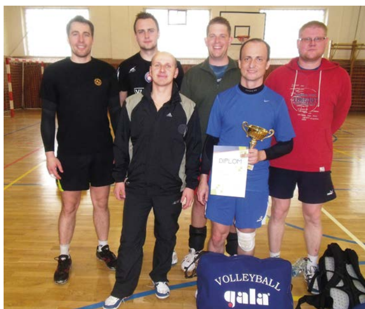
3. místo Zlín muži.