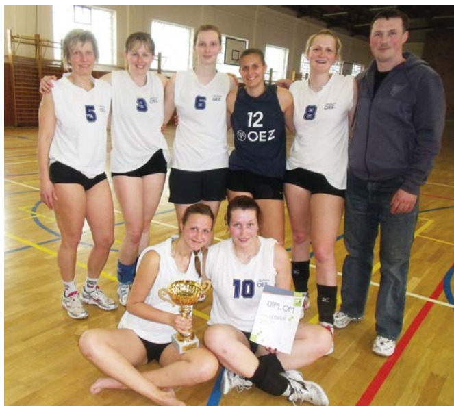
1. místo Letohrad ženy.

Po roce se na volejbalový trůn vrátily hráčky z Letohradu, překvapením byl výkon a umístění mladého družstva ze Stěbořic.