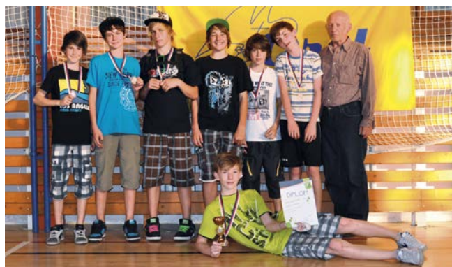
3. místo Nivnice.

Židenice, Uherský Brod si v urputném utkání poradil s Hranicemi a nakonec Dolní Bojanovice přestřílely Kašavu. Dolní Bojanovice si přenesly pohodu i do semifinále, kde rozdrtily Nové Město a dostaly se do finále. Druhý finalista vzešel ze souboje Uherský Brod–Nivnice. Brod oplatil Nivnici porážku ze skupiny a postoupil do finále. Smutní semifinalisté se utkali o bronzové medaile, tomuto zápasu kralovala Nivnice a odvezla si domů bronz. Finálový zápas přinesl radost Dolních Bojanovic, které porazily 4:2 Uherský Brod a staly se tak mistrem OFL.