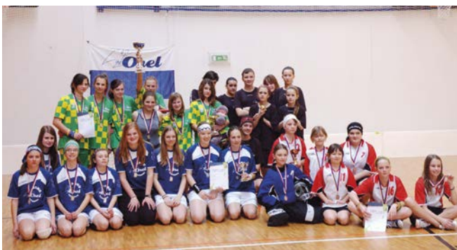
1.–3. místo žákyně.