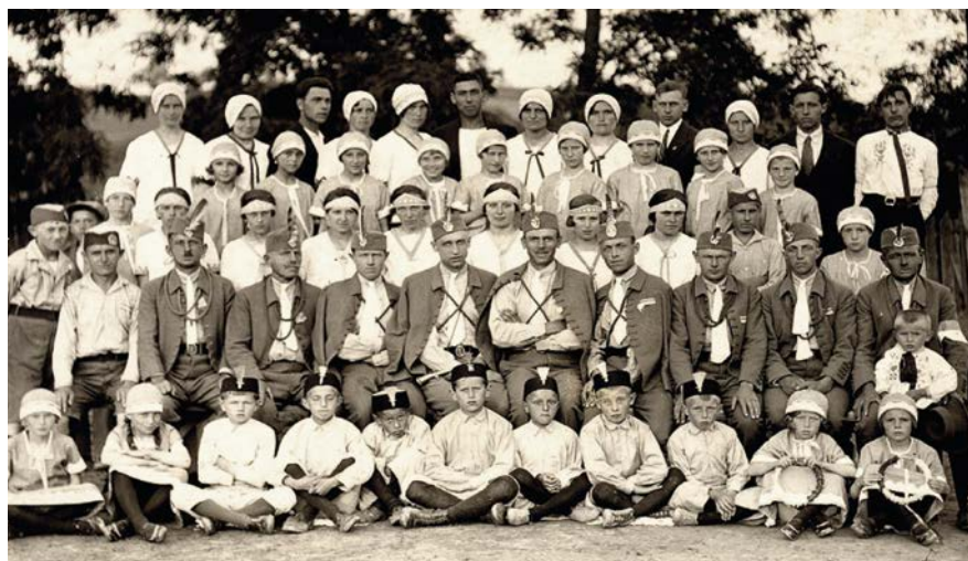
1933 – Otevření katolického domu