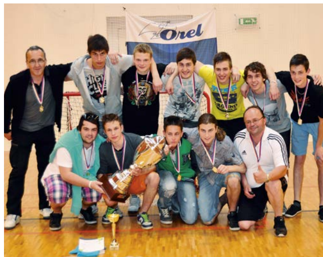
1. místo Moravský Krumlov.

Po odehrání zápasů každý s každým, v časovém úseku 2x12 minut, se vítězným týmem a mistrem OFL v kategorii juniorů pro rok 2011/2012 stal Orel Moravský Krumlov . Krumlov ovládl celý turnaj, ve kterém nepoznal hořkost porážky a kromě připsání plného bodového zisku se mohl pyšnit i vynikajícím skóre 30:9. Druhé skončilo s devíti body Uherské Hradiště , které ještě v posledním zápase živilo naději na první místo, ale v bitvě s Krumlovem podlehlo 4:5. Stupně vítězů doplnil na bronzovém stupínku „domácí“ tým z Dolních Bojanovic , který si na bodové konto připsal 7 bodů. Stíhací jízdu na třetí místo zahájily Bojanovice překvapivou výhrou nad Hradištěm a v posledním zápase zdolaly v přímé konfrontaci o bronz Blansko 2:0. Čtvrté tedy skončilo Blansko, pátý Zlín a šestý Vyškov.