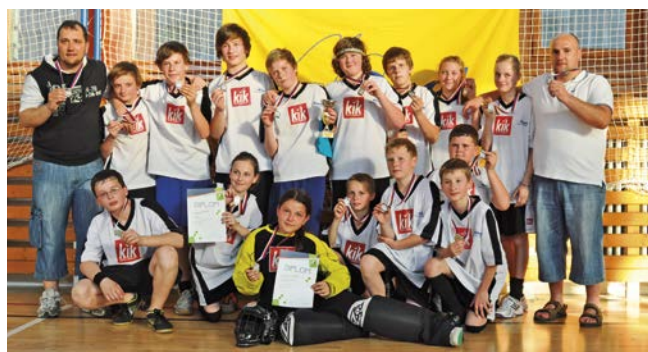
2. místo Uherský Brod.