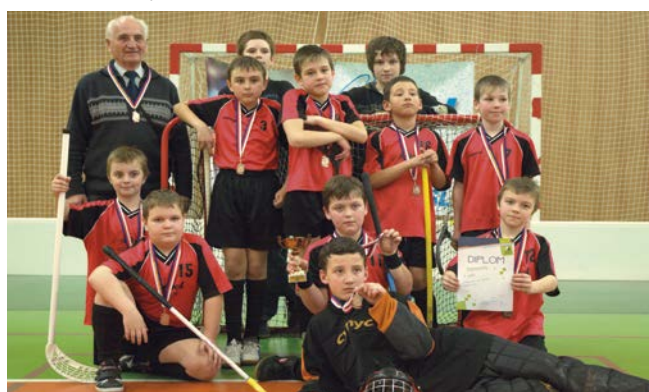
3. místo Domanín.