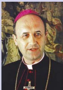
+ JAN GRAUBNER, arcibiskup duchovní rádce Orla

V orelských skupinách je taky možné vytvořit rodinnou atmosféru přijetí, lásky, klidu, pohody a radosti. Jistě nebude snadné být tak jiní než je ve světě běžné, ale za tu námahu to stojí. Možná neuvidíme plody hned. Možná si naši nevěřící orelští bratři a sestry i po letech vzpomenou na tu atmosféru, kterou vytvářeli křesťané, snad si vzpomenou i na modlitbu, s níž se v té milé atmosféře setkali, snad i je napadne hledat cestu ke Kristu a zatouží po křtu, aby získali tyto poklady. Výsledek nezáleží na nás, ale naším úkolem je vytvořit prostředí, které oslovuje, společenství, které svědčí o přítomnosti vítězného Krista.