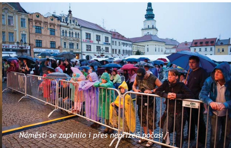
Náměstí se zaplnilo i přes nepřízeň počasí