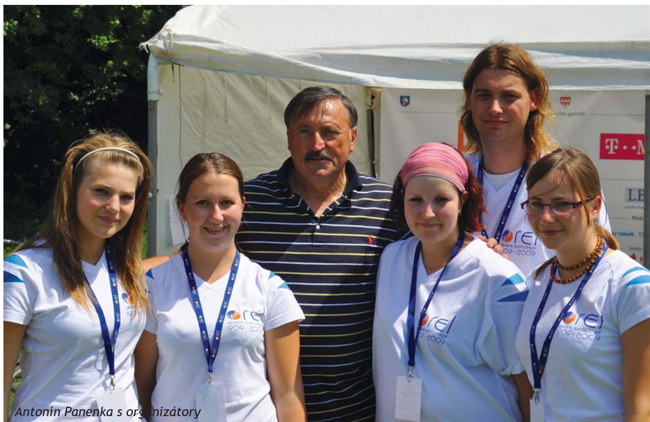
Antonín Panenka s organizátory

V průběhu let si oslavy státního svátku dne slovanských věrozvěstů sv. Cyrila a Metoděje získaly všeobecnou prestiž. Poselství slovanských věrozvěstů je stále aktuální a tato dnes již středoevropská kulturně-společenská událost se snaží inspirovat lidi dobré vůle ke konkrétní pomoci druhým v každodenním životě. RED