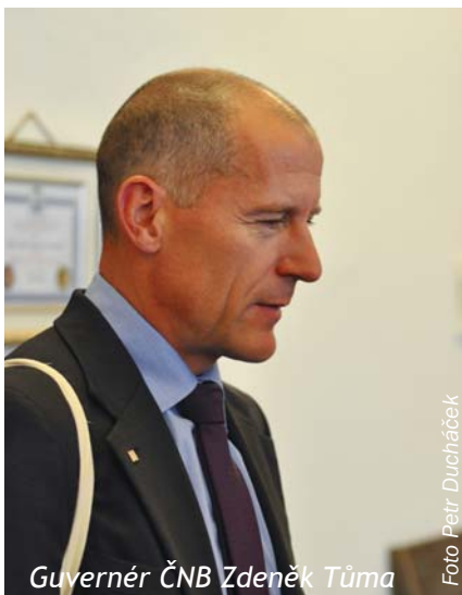
Guvernér ČNB Zdeněk Tůma