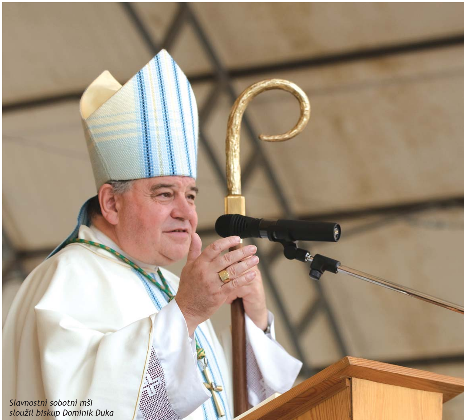
Slavnostní sobotní mši sloužil biskup Dominik Duka

Skutečnost, že je Orel křesťanskou organizací, byla poznat i na kroměřížské slavnosti. Každý den si totiž mohli návštěvníci vychutnat nějaký duchovní zážitek.