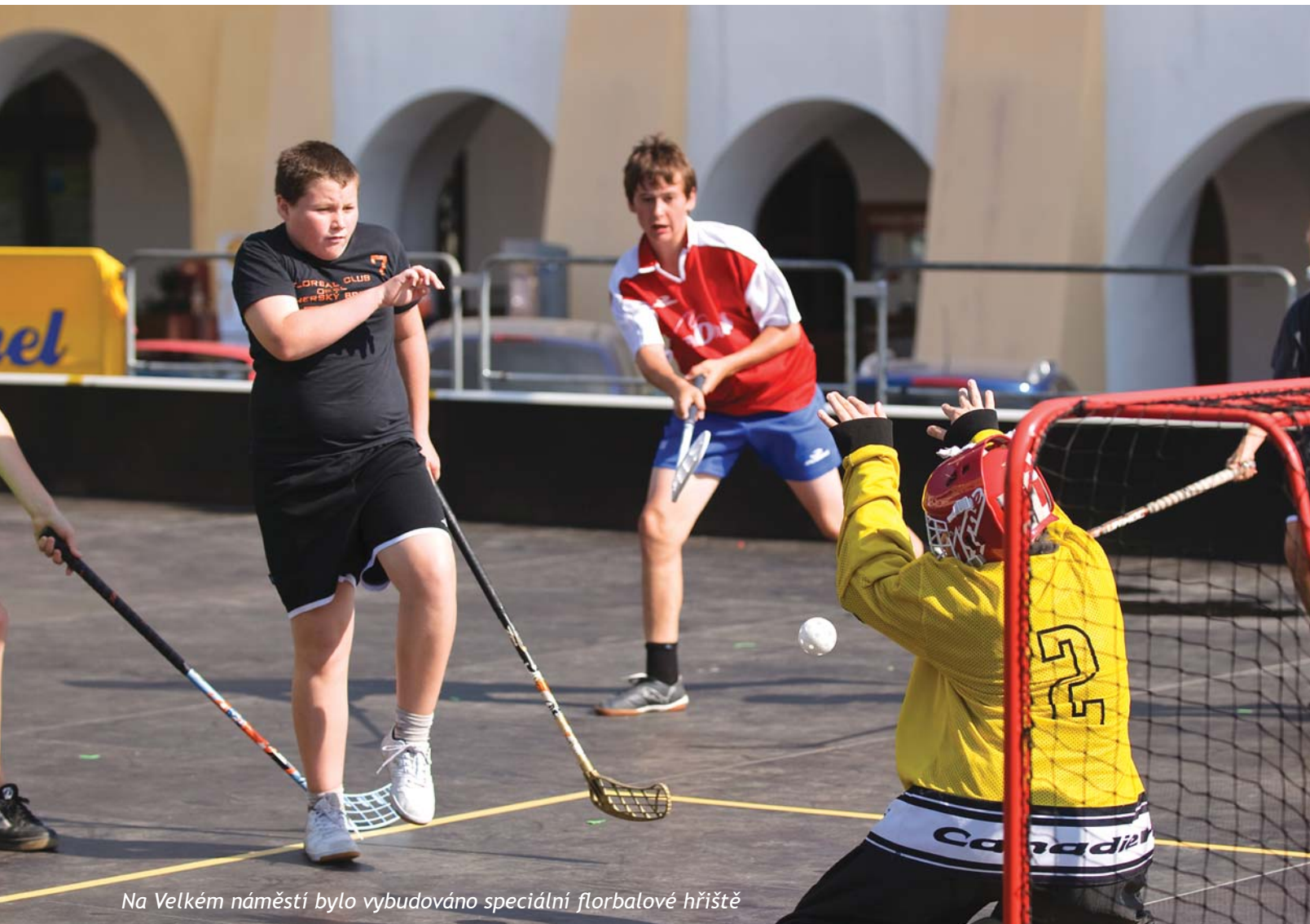
Na Velkém náměstí bylo vybudováno speciální florbalové hřiště

Své místo na kroměřížské slavnosti měly i sporty v Orlu pevně zakotvené. Účastníci si mohli zahrát turnaj v malé kopané, florbalu, stolním tenisu, volejbalu, nohejbalu, kuželnkách, šachách nebo si vyzkoušet své umění v atletice, florbalových a fotbalových dovednostech.