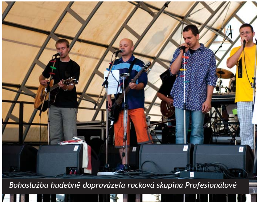
Bohoslužbu hudebně doprovázela rocková skupina Profesionálové