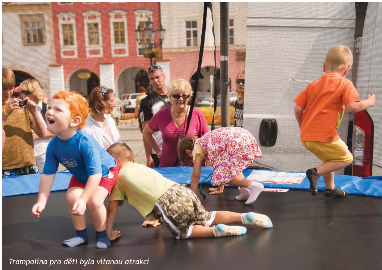
Trampolína pro děti byla vítanou atrakcí

Pro spoustu orlů, orlic i orličat byla oslava 100 let od založení Orla znamením, že tradice přetrvává. I přesto, že spousta věcí tradici připomínala, objevilo se mnoho nového. Mezi takové novoty patřily například netradiční sporty.