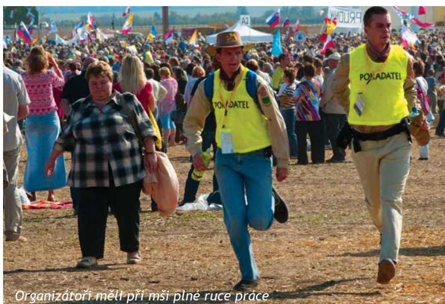
Organizátoři měli při mši plné ruce práce