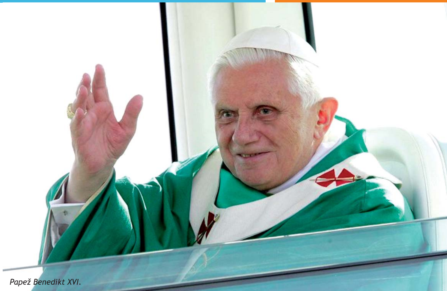
Papež Benedikt XVI.

první letadlo a na ranvej vystupuje prezident republiky. Další vládní speciál o několik minut později má na palubě Benedikta XVI., který vzápětí projíždí mezi poutníky. Následuje mše svatá.