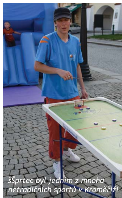
ššprtec byl jedním z mnoha netradičních sportů v Kroměříži

sportů spadaly i workshopy, převážně taneční. Místo činu: Dům kultury. Tanečnice, tanečníci, sportovkyně i sportovci