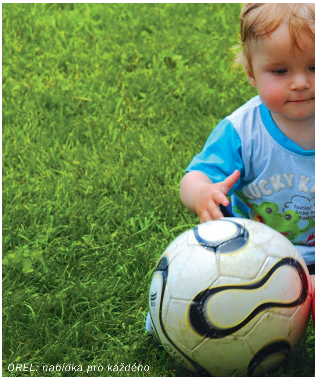
OREL: nabídka pro každého