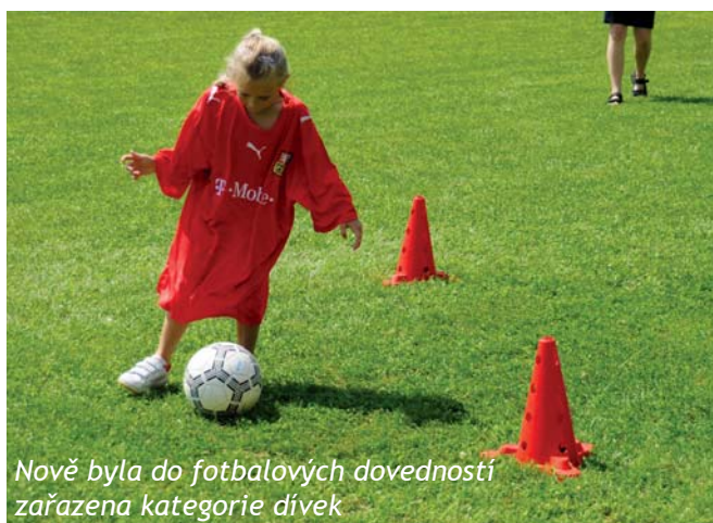
Nově byla do fotbalových dovedností zařazena kategorie dívek

Souběžně s turnajem ve stolním tenise probíhalo na fotbalovém hřišti finálové kolo již pátého ročníku soutěže ve fotbalových dovednostech. Patronem projektu byl slavný československý reprezentant Antonín Panenka. I letos pečlivě sledoval