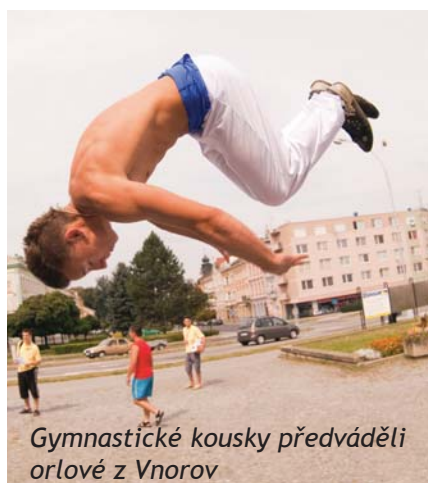
Gymnastické kousky předváděli orlové z Vnorov

Ty se odehrávaly jak v pátek, tak v sobotu. Účastníci oslav si sice museli trochu zajít, ale ti, kteří došli až na určená mís-