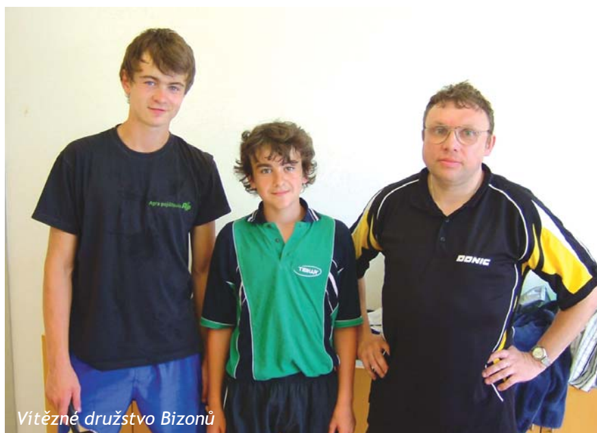
Vítězné družstvo Bizonů