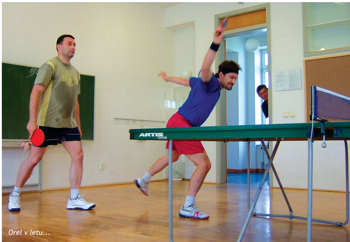
Orel v letu...

„Sport všude, kam se podíváš“ – možná i touto parafází slov klasika by mohl návštěvník hodnotit Dny lidí dobré vůle na Velehradě.