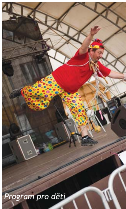
Program pro děti

Od sedmnácti hodin bylo v plánu hlavní vystoupení, které mělo za cíl zhodnotit oslavy a následně představit historii i současnost Orla v náležitě důstojné formě. Večerní program bohužel kvůli dešti neproběhl zcela podle představ organizátorů.