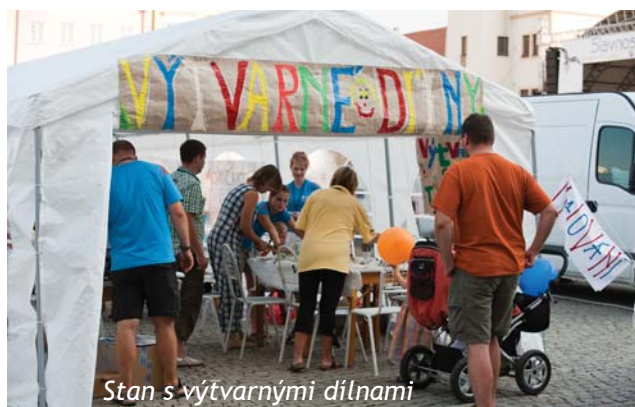
Stan s výtvarnými dílnami

očekávání. Jak říká starosta Orla: „Mimo jiné jsem doufal, že si ověříme organizační možnosti, že se setkáme. To se podařilo. Možná se zdálo se, že je méně lidí, ale nezapomeňme, že Kroměříž je velká a aktivity jsme měli po celém městě. Když pohlédnu z té lidské stránky, tak se málo kdy stane, že se sejdou všichni z celé republiky. Právě