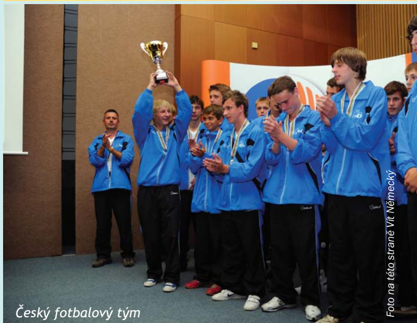
Český fotbalový tým