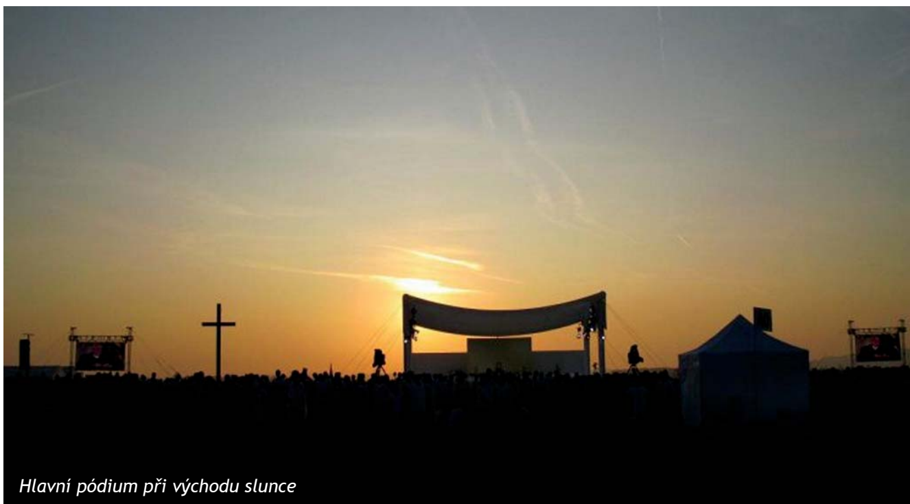
Hlavní pódium při východu slunce