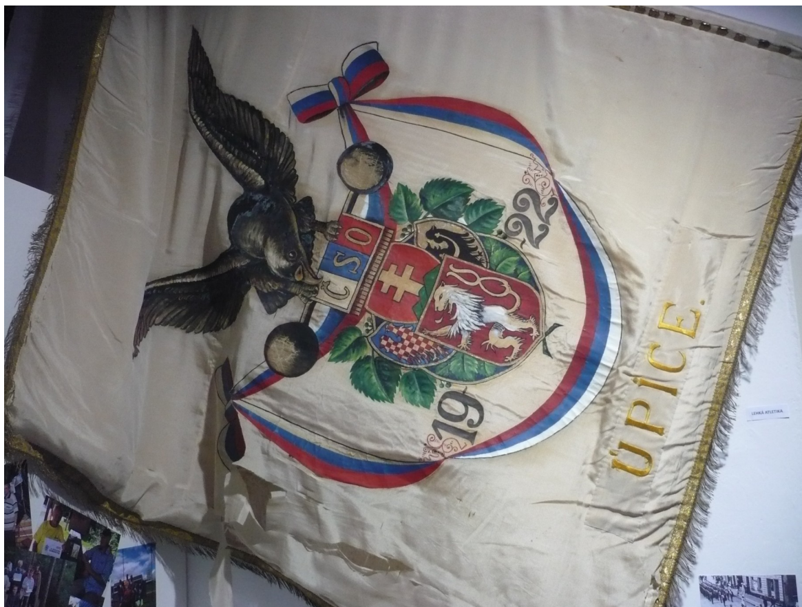
Historický prapor jednoty